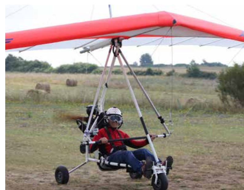
I nanotrike con ali dedicate consentono di volare in delta con discrete prestazioni e con costi ai minimi storici

I piani del Bloop sono scaricabili gratuitamente, la costruzione richiede 300 ore e circa 4.000 euro totali, motore compreso