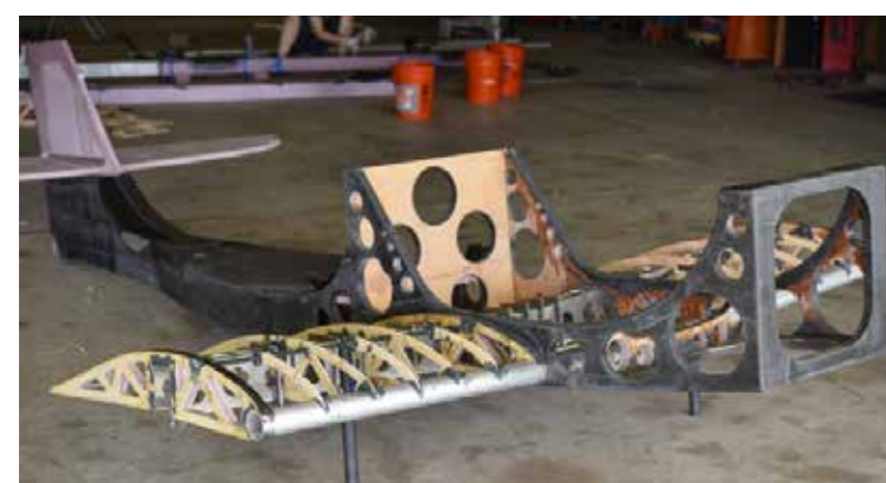
La struttura dello Skydock è mista in legno, alluminio e carbonio, il kit escluso il motore costa 4.000 dollari